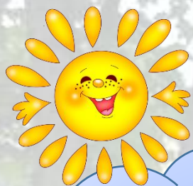
ГРАФИК РАБОТЫ КОНСУЛЬТАЦИОННОГО ЦЕНТРА «СОЛНЫШКО» МАДОУ 9

Понедельник – Пятница 8.00 – 20.00 Очно и дистанционно